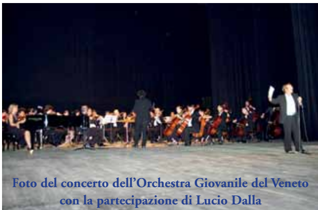
Foto del concerto dell'Orchestra Giovanile del Veneto con la partecipazione di Lucio Dalla